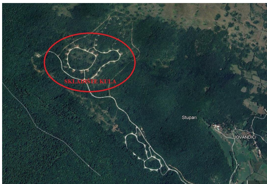
SL.1 Skladište Kula Mrkonjić Grad

U sklopu skladišta Kula Mrkonjić grad postoje 22 objekata koje je potrebno obezbjediti sa vanjskom hidrantskom mrežom i potrebnim brojem hidranata. U sklopu kompleksa Tehnička zona I ima obezbjeđenu hidrantsku mrežu dok Tehnička zona II nema te je ona predmet ove projektne dokumentacije. Vodosnabdjevanje je obezbjeđeno preko gradske vodovodne mreže, a u sklopu kompleksa postoji i rezervoar za vodu čija je zapremina cca 300 m 3 .